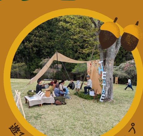
遊び・体験・ワークショップ

バオバブ堂, atelier multicolore, レイニーデイクラフト, koe Lab., MOB BuRGLAR, 3branches, 杉本商店