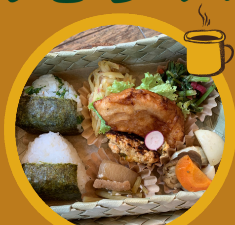
地元のおいしいもの