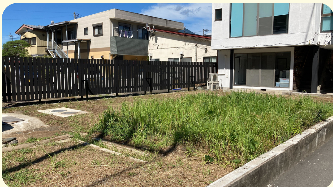
草がはえてたり、はえてなかったり