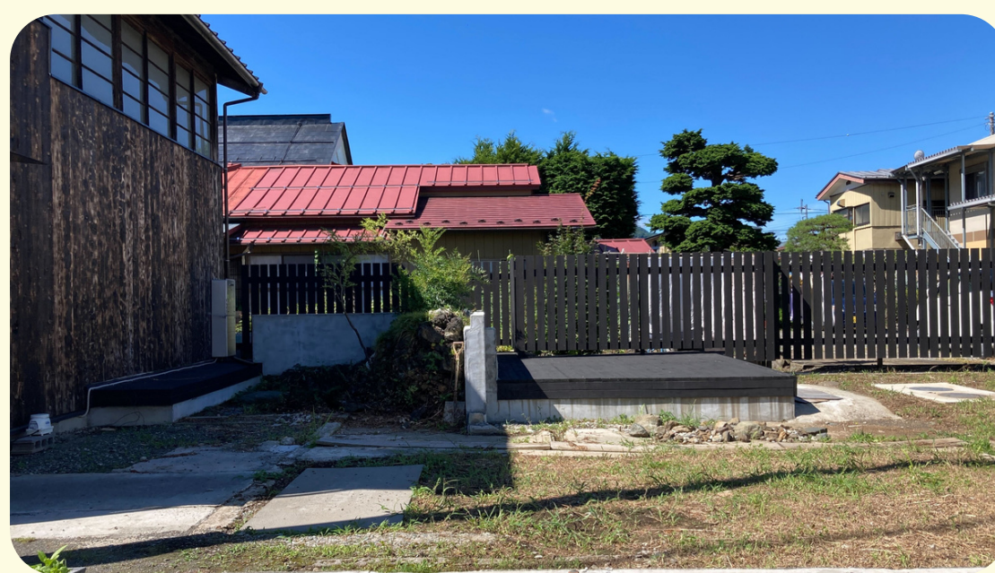
この"おく"にあるものはなんだろう？

日 時：9月から11月までの毎週土曜日9:00～12:00(スケジュールは裏面へ) 初回9月9日(土)9:00～12:00